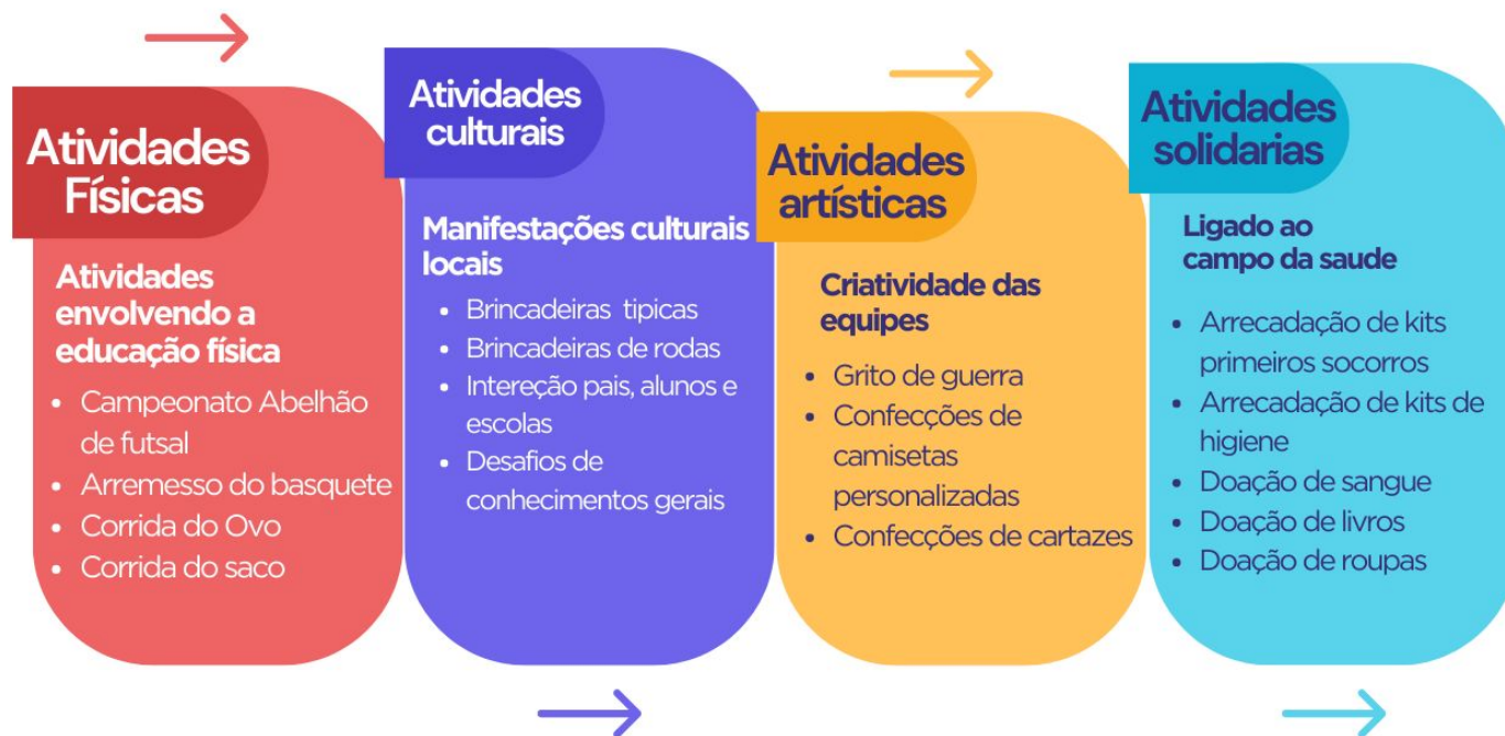
Figura 1 – Mapa mental das atividades propostas na Gincana Abelhão